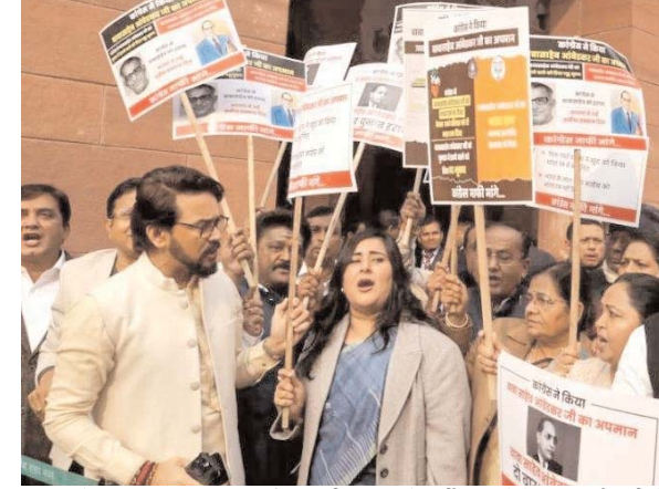
भाजपा के सांसद अनुराग ठाकुर और बांसुरी स्वराज ने पार्टी सदस्यों के साथ नई दिल्ली में शीतकालीन सत्र के दौरान संसद में विपक्षी नेताओं के खिलाफ विरोध प्रदर्शन किया।

केंद्रीय मंत्री शिवराज चौहान ने कहा कि मल्लिकार्जुन खरगे और राहुल गांधी ने अभी प्रेस कॉन्फ्रेंस की। हमें लगा कि वे आज की घटना पर माफ़ी मांगेंगे। लेकिन उन्होंने ऐसा नहीं किया। मुझे समझ नहीं आया कि उन्होंने प्रेस कॉन्फ्रेंस क्यों की। उनकी प्रेस कॉन्फ्रेंस में उनका अहंकार झलक रहा था। मैं उनका व्यवहार देख रहा था। लेकिन आज उन्होंने (राहुल गांधी) जो किया वह सभ्य समाज के लिए अकल्पनीय है। आज जब भाजपा सांसद मकर द्वार पर विरोध कर रहे थे, तो राहुल गांधी वहां आ गए। सुरक्षाकर्मियों ने उन्हें अंदर जाने के लिए दूसरी जगह का इस्तेमाल करने को कहा। लेकिन वे जानबूझकर वहां आए। उस प्रेस कॉन्फ्रेंस में भी उनका अहंकार झलक रहा था। आज मेरा मन भारी है, व्यथित है, पीड़ा से भरा हुआ है। मैं एक दर्जन बार लोकसभा और विधानसभा का सदस्य रहा हूं।