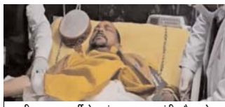
भारतीय जनता पार्टी के सांसद प्रताप सारंगी और मुकेश राजपूत मुंबई को संसद भवन की सीढियों से गिर कर घोटिल हो गए।

सदस्य फनानॉन कोन्याक ने आरोप लगाया कि वह जब संसद के मकर द्वार के पास अन्य सांसदों के साथ प्रदर्शन कर रही थीं तो लोकसभा में विपक्ष के नेता राहुल गांधी उनके काफी समीप आ गए और उन पर चिल्लाने लगे।