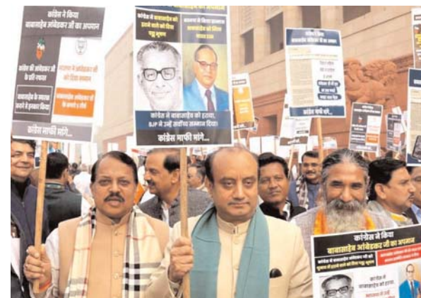
भाजपा सांसद सुधांशु त्रिवेदी ने नई दिल्ली में शीतकालीन सत्र के दौरान पार्टी सांसदों के साथ एक तख्ती लेकर विरोध प्रदर्शन किया।