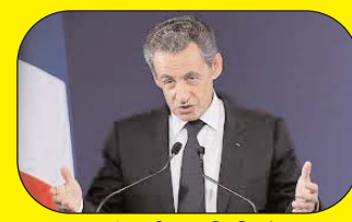
फ्रांस के पूर्व राष्ट्रपति निकोलस सरकोजी की बड़ी मुश्किलें, भ्रष्टाचार के मामले में मिली जेल की सजा