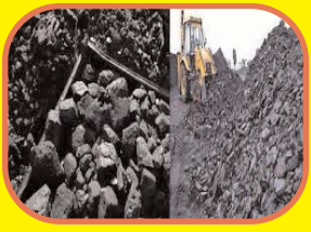
वित्त वर्ष 2024-25 की अप्रैल-अक्टूबर अवधि के दौरान कोयले के आयात में 3.1 प्रतिशत की उल्लेखनीय कमी आई