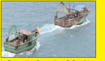
उत्तरी जाफना में भारतीय मछुवारी पर टूटी भीतकॉर्ड सेना, 19 लोगों को नौका समेत किया गिरफ्तार