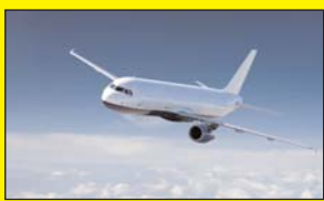
मार्च 2024 से जबलपुर से दिल्ली और मुंबई के लिए यात्री विमान सेवा प्राप्त होगी