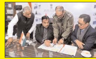
गडकरी ने अरुणाचल प्रदेश में एनएच-913 (फुटियर राजमार्ग) के लाइव-सर्तरी संरक्षण के निर्माण के लिए 2,248.94 करोड़ रुपये की स्वीकृति दी