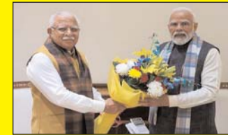
हरियाणा के मुख्यमंत्री ने प्रधानमंत्री मोदी से मुलाकात की