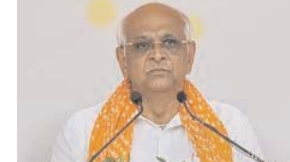
गुजरात सरकार ने पेश किया 3.32 लाख करोड़ रुपये का बजट, नहीं लगेगा कोई भी नया टैक्स

पूर्व कानून मंत्री रविशंकर प्रसाद ने संविधान के प्रविधानों का हवाला देते हुए बताया कि कर्नाटक समेत दक्षिण के सभी राज्य भारत के अभिन्न अंग हैं और इसे अलग करने की बात करना सीधे-सीधे संविधान के विरुद्ध है। उन्होंने कहा कि सांसद को चुनाव के लिए नामांकन भरने से लेकर संसद की सदस्यता के शपथ ग्रहण तक देश की एकता और अखंडता को अक्षुण्ण रखने की शपथ लेनी पड़ती है। डीके सुरेश ने इन सभी का उद्धेयन किया है।