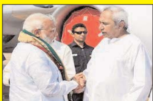
प्रधानमंत्री 3-4 फरवरी को ओडिशा और असम का दौरा करेंगे