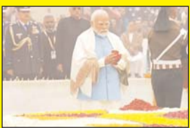
पीएम मोदी ने राजघाट पर राष्ट्रपिता महात्मा गांधी की दी श्रद्धांजलि