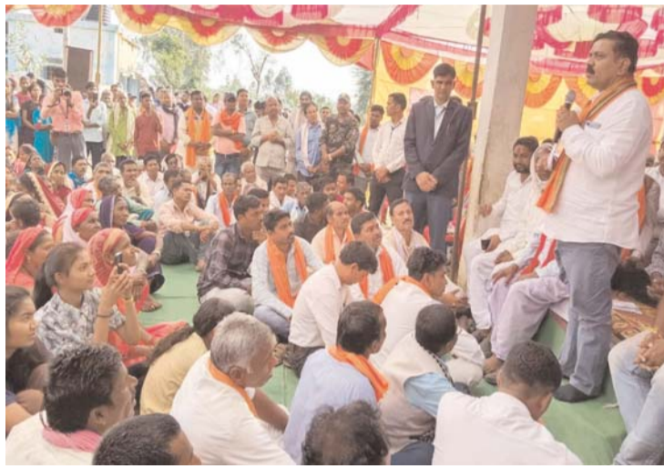
लिये कई घोषणाएं की। उन्होंने बड़ौदा कला के लिए 15 लाख रुपए, ग्राम सिंगारपुर में सर्वसमाज के सामुदायिक भवन एवं मंच के लिए 5 लाख रुपए तथा ग्राम