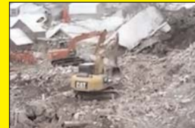
चीन में कहर का कहर, यूचान प्रांत में तैडरलाइड से अब तक 31 लोगों की मौत