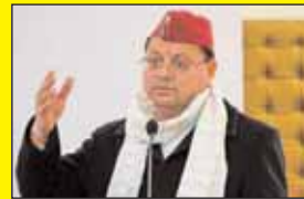
उत्तराखंड: 2 फरवरी को UCC का ह्रापट सौपेगी कमेटी, बजट सत्र में बिल पास कराएगी प्रदेश सरकार

परीक्षा पे चर्चा कार्यक्रम : स्कूली परीक्षाओं में सफलता के बाद जीवन की पाठशाला की परीक्षाएं शुरू हो जाती हैं