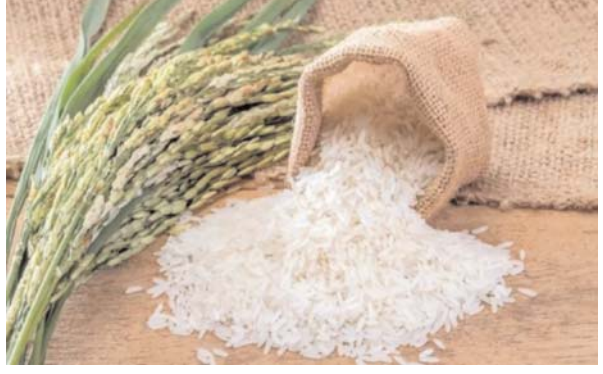
चावल की कीमतें धीरे धीरे बढ़ रही हैं। चावल की ज्यादा पैदावार के बावजूद यह कीमतें बढ़ रही हैं। पाकिस्तान गैर-बासमती चावल के मुख्य रूप से इंडोनेशिया, सेनेगल, माली, अइवरी कोस्ट और केन्या को निर्यात कर रहा है और प्रीमियम बासमती चावल यूरोपीय संघ, कतर और सऊदी अरब को निर्यात करता है। भारत सरकार के चावल के निर्यात पर बैन का पाकिस्तान को जबरदस्त फायदा हो रहा है। पाकिस्तान का चावल निर्यात इस साल जून तक रिकॉर्ड ऊंचाई पर पहुंचने की संभावना है। भारत के निर्यात पर लगाए अंकुशों की वजह से दुनिया के खरीदारों को इस्लामाबाद से ही चावल की खरीदारी करनी पड़ रही है। पाकिस्तानी चावल की मांग बढ़ने से इस देश को पिछले 16 साल का सबसे ज्यादा दाम प्राप्त हो रहा है।

एजेंसी। भारत दुनिया में चावल का सबसे ज्यादा निर्यात करने वाला देश है। हालांकि भारत ने पिछले साल अपने देश से चावल बेचने पर प्रतिबंध लगा रखा है। घरेलू जरूरतों को पूरा करने के लिए बासमती चावल बेचने पर यह बैन लगा रखा है। इस वजह से पाकिस्तान के चावल की मांग दुनिया में बढ़ने लगी है यानी भारत ने चावल बेचने पर प्रतिबंध लगाया, तो भारत की वजह से कंगाल पाकिस्तान को मौका मिल गया। इस कारण वह चावल बेचकर मुनाफा कमा रहा है। भारत सरकार ने चावल बेचने पर जो प्रतिबंध लगा रखा है, उसका फायदा कंगाल पाकिस्तान को हो रहा है। पाकिस्तान का चावल निर्यात इस साल जून महीने तक रिकॉर्ड ऊंचाई पर पहुंचने की संभावना जताई जा रही है। हालांकि चावल विदेशों में भेजने के कारण पाकिस्तान में भी