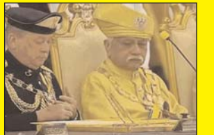
मलेशिया के नए राजा बने इब्राहिम इस्कंदर: वेता भारतीय सेना में कैप्टन रह चुका