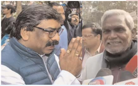
झारखंड में सियासी घटनाक्रम तेजी से बदला है। मुख्यमंत्री हेमंत सोरेन ने इस्तीफा दे दिया है और उनकी जगह अब चम्पई सोरेन को विधायक दल का नेता चुना गया है। वहीं आज ईडी हेमंत सोरेन से पूछताछ भी कर रही है।