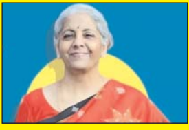
वित्तमंत्री आज पेश करेंगी देश का बजट