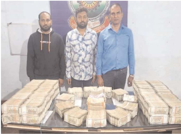
बता दें लोकसभा चुनाव की घोषणा से पहले ही दुर्ग पुलिस एक्टिव हो गई है। एसपी राम गोपाल गर्ग ने अवैध करोबार पर नजर रखने सभी थानों को निर्देश जारी किया है। इस

भिलाई। अभी लोकसभा चुनाव की तारीखों का ऐलान भी नहीं हुआ और भिलाई में नगदी का मिलना शुरू हो गया है। बुधवार को भट्टी पुलिस व एसीसीयू की संयुक्त टीम ने कार की डिक्की से ढाई करोड़ से ज्यादा की नगदी बरामद की है। पुलिस को मुखबिर से सूचना मिली और घेराबंदी कर दो कार रोकें गए। इनमें से एक कार में नगदी मिली है। इस मामले में पुलिस ने तीन लोगों को हिरासत में लिया है। नगदी के संबंध में कोई भी वैध दस्तावेज नहीं दिखाए जाने पर इसे धारा 102 CRPC के तहत जब्त किया गया। पुलिस ने इसकी सूचना आयकर विभाग को भी दे दी है।