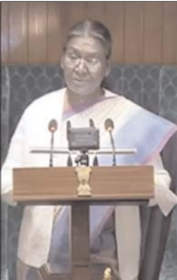
इस दौरान राष्ट्रपति ने नारी शक्ति वंदन अधिनियम का भी जिक्र किया। उन्होंने कहा कि मेरी सरकार ने लाखों युवाओं को सरकारी नौकरी दी है। नारी

तेजी से विकसित हो रहा भारत: राष्ट्रपति - राष्ट्रपति द्रौपदी मुर्मू ने कहा कि दुनिया में गंभीर संकटों के बावजूद भारत तेजी के साथ विकसित हो रहा है। मेरी सरकार कई महत्वपूर्ण विधेयक लेकर आई है। ये कानून विकसित भारत की सिद्धि की मजबूत पहल हैं। क्रिमनल जस्टिस सिस्टम अब इतिहास बन गया है।