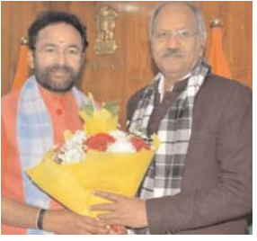
उज्जैन और काशी की तर्ज पर बनेगा राजिम कॉरीडोर