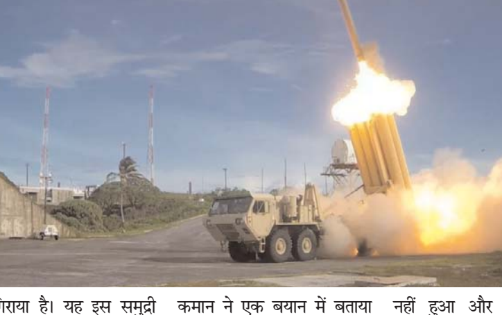
मार गिराया है। यह इस समुद्री मार्ग पर अमेरिकी गश्ती बल को निशाना बनाकर किया गया नवीनतम हमला है। अधिकारियों ने बुधवार को यह जानकारी दी। अमेरिकी सेना की मध्य कमान ने एक बयान में बताया कि हमला मंगलवार देर रात आर्ले बर्क श्रेणी के निर्देशित मिसाइल विध्वंसक यूएसएस ग्रावेली को निशाना बनाकर किया गया। हालांकि, हमले में कोई हताहत

एजेंसी। इजराइल और हमामस में जंग के साथ ही लाल सागर में हूती विद्रोहियों ने भी इजराइल और अमेरिका से पंगा ले लिया है। लाल सागर में कारोबारी जहाजों पर निशाना बनाने वाले हूती विद्रोहियों ने अमेरिकी सैन्य जहाज को भी निशाना बनाने का काम किया। इसके बाद से ही अमेरिका हूतियों पर हमलावर है। ताजा मामले में अमेरिकी नौसेना के विध्वंसक पोत ने लाल सागर में हूती विद्रोहियों की मिसाइल को मार गिराया है।