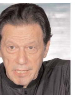
की सजा सुनाई थी। उनके साथ पाकिस्तान तहरीक-ए-इसाफ पार्टी के लीडर और पूर्व विदेश मंत्री शाह महमूद कुरैशी को भी सजा हुई थी। खान को 2 दिनों में 24 साल की जेल की सजा सुनाई गई है।

इस्लामाबाद, पाकिस्तान में 8 फरवरी को होने वाले आम चुनाव से 8 दिन पहले पूर्व प्रधानमंत्री इमरान खान को दूसरी बार सजा सुनाई गई है। खान और उनकी पत्नी बुशरा बीबी को तोशाखाना रेप्रेस मामले में 14 साल की जेल की सजा हुई है। इसके बाद खान 10 साल तक किसी भी सरकारी पद पर नहीं रह सकते हैं, फैसले के तहत दोनों पर करीब 23.37 करोड़ रुपए का जुर्माना भी लगाया गया है। इससे पहले कल यानी मंगलवार को रावलपिंडी की स्पेशल कोर्ट ने खान को सीक्रेट लेटर चोरी के मामले में 10 साल